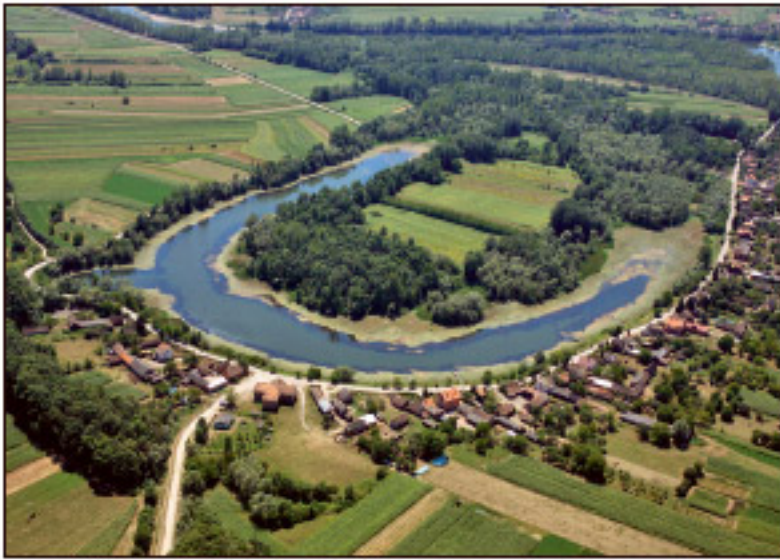
Slika 5: Rukavac Tišina kod Mužilovčice