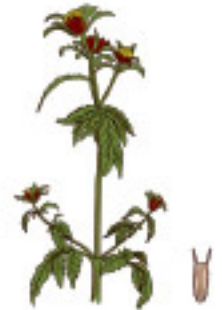
Slika 6: Dvozub ( Bidens tripartitus )

Na muljevitim otvorenim obalama rijeke Save, gdje poplava ostavlja svježi nanos, raste dvozub ( Bidens tripartitus ), biljka koja stvara sjemenku poput harpuna. Poplava prenosi sjeme i rasprostire ga na dno rijeke, a kada vodostaj Save padne svuda na obali raste nova generacija biljaka. Ova je pojava moguća samo u prirodnim vodotocima.