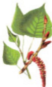
Slika 8: Crna topola ( Populus nigra )

Na prirodnim riječnim obalama česta je bijela vrba ( Salix alba ), koja može pod vodom biti čak do 160 dana. Slično je i s crnom topolom ( Populus nigra ) čije sjeme možemo zapaziti kako leti poput sitnog perja.