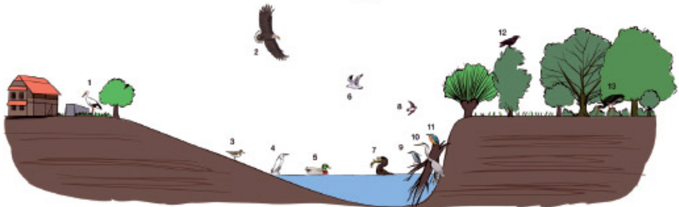
Slika 15: Rijeka Sava - kao hranilište ptica

Ptice: 1 - bijela roda; 2 - štekavac; 3 - mala prutka; 4 - mala bijela čaplja; 5 - divlja patka; 6 - riječni galeb; 7 - veliki vranac; 8 - bregunica; 9 - gak; 10 - siva čaplja; 11 - vodmar; 12 - gavran; 13 - crna roda