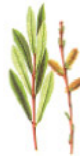
Slika 9: Bijela vrba ( Salix alba )