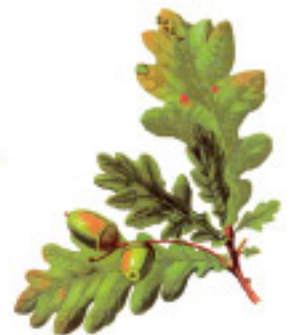
Slika 7: Hrast lužnjak ( Quercus robur )

Posavinu pokrivaju nizinske poplavne šume s vrstama koje podnose oscilacije vodostaja i duži period poplavlivanja. Područja koja su često poplavljena podnose vrste kakve su vrba, topola, hrast lužnjak i poljski jasen.